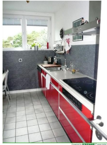
■ Vakante Küchenzeile