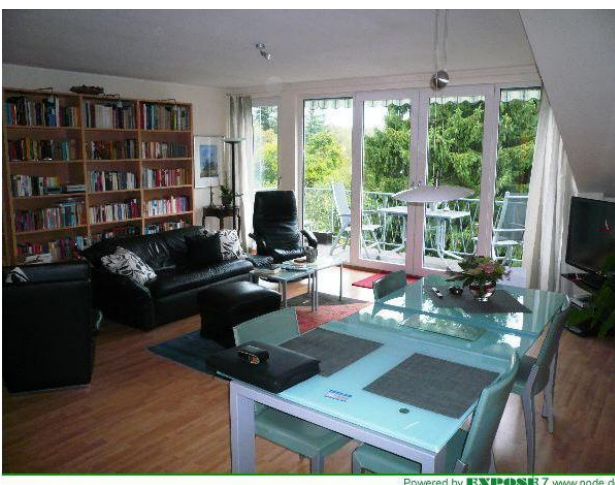
■ Wohn- Essbereich mit Balkon