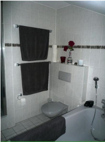
■ Freist. Badewanne