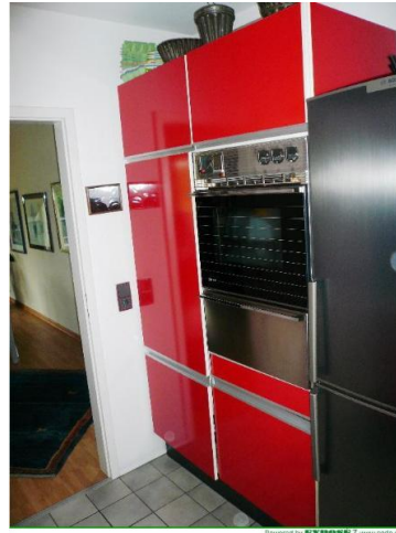
■ Vakante Küchenzeile 2